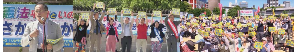
《5.3 輝け！憲法 平和と命と人権を おおさか総がかり集会》5000人が扇町公園に集まり武器で平和は守れない！憲法を生かして平和な日本へと集会とパレードを行いました。