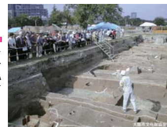
難波宮跡発掘調査現地説明会のようす (1999年10月23日)

大阪市という日本有数の大都市で、巨大な埋蔵文化財包蔵地にあつて、地域固有の文化財行政の核となるべき施設を解散することは、愚挙です。大阪の宝・市民の宝ともいえるべき文化財を顧みない行政政策を改めさせなければなりません。 大阪市はなぜ大阪市の文化財協会解散を急ぐのか、市民に納得いく説明会を開くことを求めます。