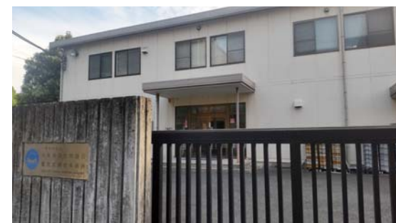
難波宮史跡公園の大阪市文化財協会

文化財センター」の業務と重複していると判断し、統廃合を決定。先には発掘事業の民営化も企図され、文化財行政はいっそう後退する可能性があります。