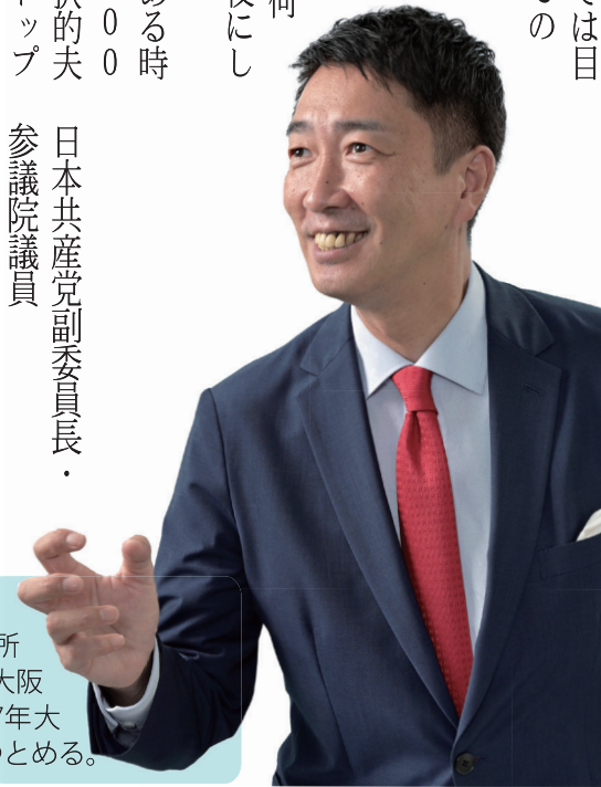
衆議院議員 辰巳 孝太郎